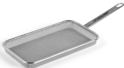
PARRILLA DE MALLA METÁLICA DE AGUJERO FINO