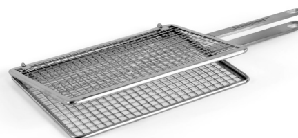
PARRILLA PARA COCOCHAS