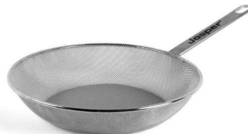
SARTÉN DE MALLA METÁLICA DE AGUJERO FINO