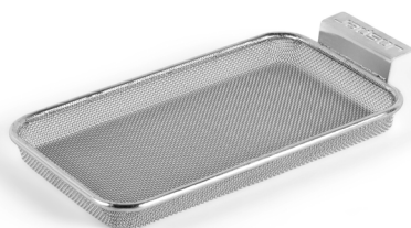
MINI PARRILLA PINZA MICROPERFORADA

El dominio de Bittor sobre la brasa gastronómica le ha llevado a innovar en las técnicas de braseado y le ha permitido diseñar tanto la Parrilla Vasca Josper como una serie de parrillas y sartenes perfectas para cocinar a la brasa el mejor producto.